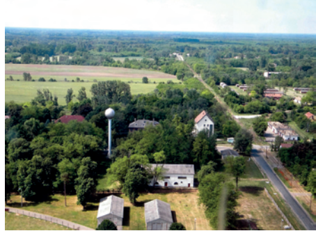
8. ábra. A lőtér központi része, Táborfalva helyőrség

a lőtér nagyarányú technikai fejlesztése. Tovább folytatták a lőtér elektromos árammal való kiépítését, amit 1989-ben fejeztek be. 1990-től kiépült a lőtér számítógépes célmozgatása is (7. ábra). 1996 márciusától több ütemben az Amerikai Egyesült Államok hadseregének IFOR erői (nemzetközi békefenntartó) tartózkodtak itt. Velük kapcsolatban feladat volt, hogy a lőteret folyamatos üzemmódban a lövészeikre biztosítani kellett. Ugyanebben az évben kialakították és megépítették egy új, harcjárművek tárolására és javítására is alkalmas telephelyet a lőtér bázisán.