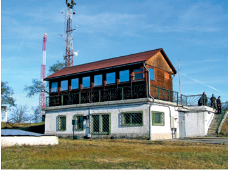
7. ábra. A lőtér központi vezérlőtornya