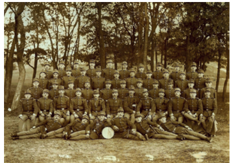
2. ábra. Csoportkép a 24-ik vadász zlj. szakaszának katonáiról az örkényi golyófogó fal előtt

Ugyanez év szeptember 4-én újabb szerencsétlenség történt. Köz-