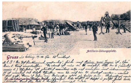
3. ábra. Tüzérségi gyakorlat a XX. század elején