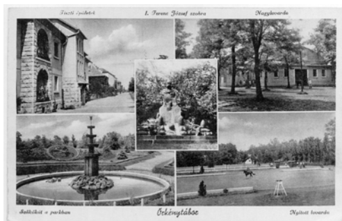
5. ábra. A tiszti lakótelep és környéke egy 1930 után készült képeslapon

Az egyedülállóan ideális örkényi terepet jól ismerték a lovasok (valamint azok a bizonyos nagy emberek), mivel rendszeresen részt vettek az 1926 végén megalakult Örkényi Rókafalka Társaság vadászatain. A falkavadász társaságot polgári szervezatként gróf Csáky Károly honvédelmi miniszter kezdeményezésére és támogatásával hozták létre. A kopók elhelyezésére a Honvédség kezelésében lévő kincstári birtok majorjában biztosítottak helyet. A kutyákat 1927-ben, Angliában vásárolták és még ebben az évben elkezdődtek a vadászatok. A falka mestere és a vadászatok vezetője gróf Endrödy Rudolf volt 1932 végéig, amikor is a falkát teljes egészében átvette a Lovaglótanárképző iskola (PACHL é. n.). 1930-tól Európa egyik legnagyobb, mind színvonalában, mind felszereltségében a legjobbak közt említhető lovascentruma épült itt fel. Hasonlóval csak a franciák Saumur (Szomür), a németek Hannoverrel, az olaszok Pineroloval vagy az oroszok Szentpétervárral dicsekedhettek. Az örkénytábori